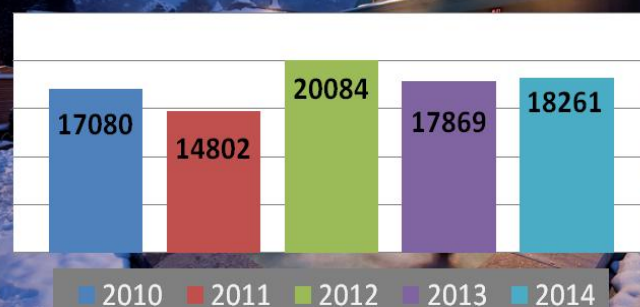
Evolution des entrées aux Bains du Couloubret en février